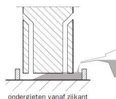
ondergieten vanaf zijkant

Zorg voor voldoende overhoogte van de bekisting. Ter vermindering van luchtinsluitingen en voor het ondergieten zonder holle ruimten slechts vanuit één zijde of hoek continu gieten zodat een aaneengesloten gietfront in de voeg ontstaat